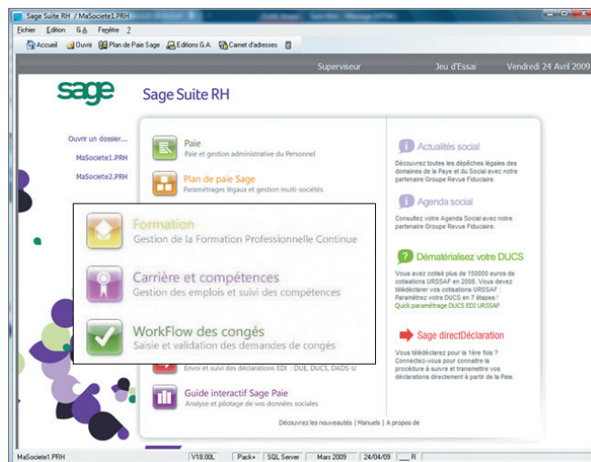
Accès facile aux fonctions RH

© Sage 2009 – Société par Actions Simplifiée au capital de 500 000 euros. Siège social : 10, rue Fructidor – 75834 Paris cedex 17 – RCS Paris 313 966 129. La société Sage est locataire-gérant des sociétés Adonix, Ciel, Sage FDC, XRT et Euratec. Les informations contenues dans le présent document peuvent faire l'objet de modifications sans notification préalable. Création : www.whynot-communication.fr - 06/2009