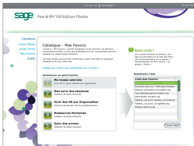
Accès direct par le responsable RH, Formation, DAF.